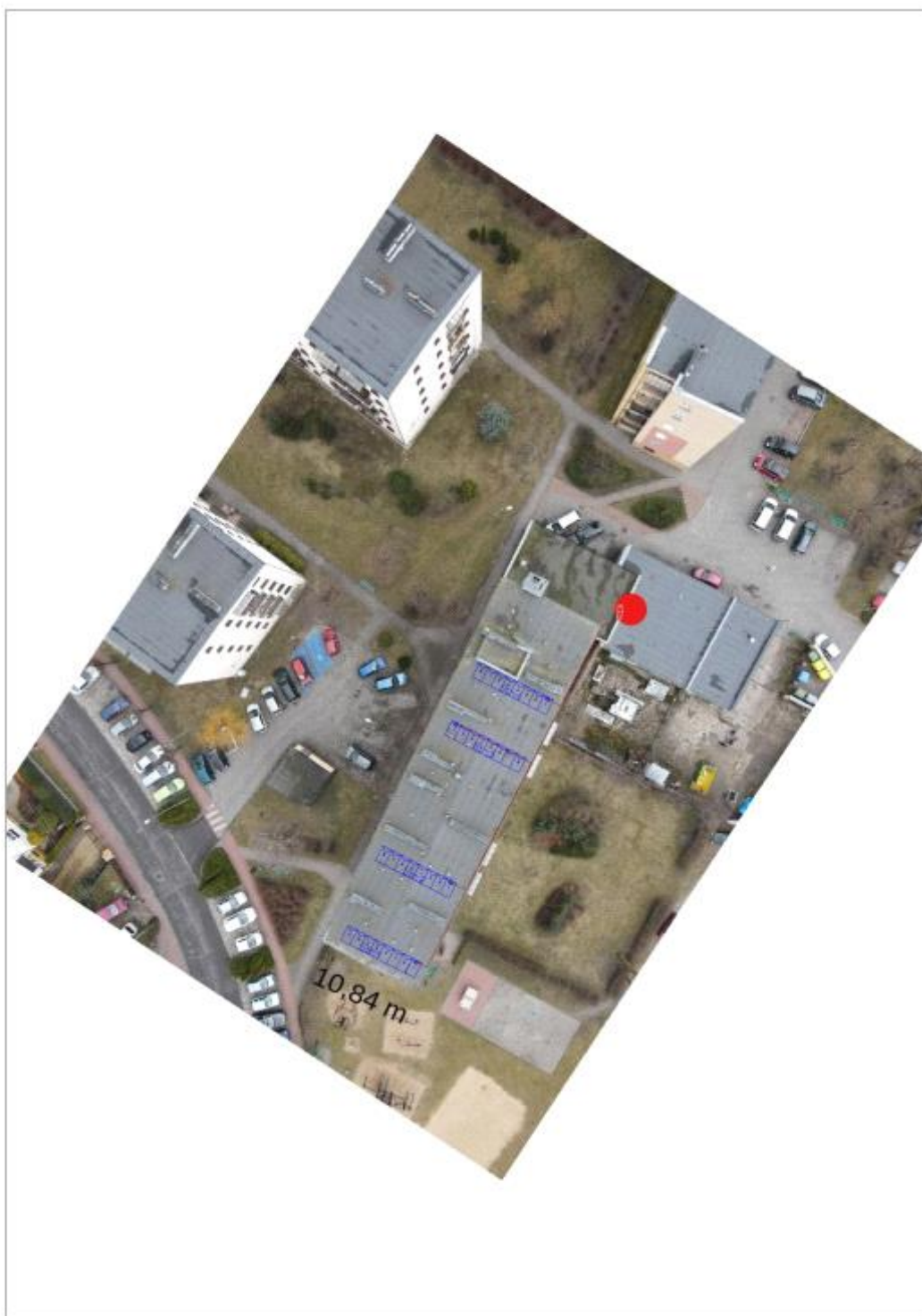
Figura 2: Umieszczenie generatora fotowoltaicznego i grupy konwersji